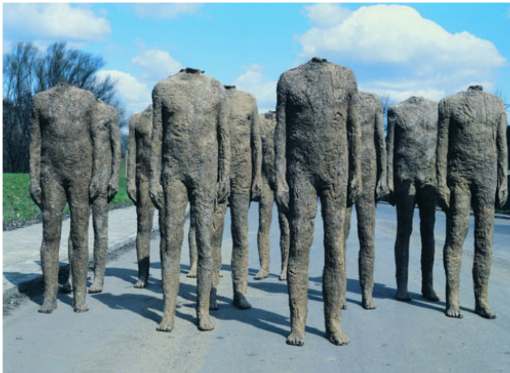
Magdalena Abakanowicz, Tłum , 1988.

Jakie refleksje o współczesnej cywilizacji wyrażają twórcy w swoich dziełach? Odpowiedz na podstawie interpretacji podanego tekstu kultury oraz wybranych tekstów literackich.