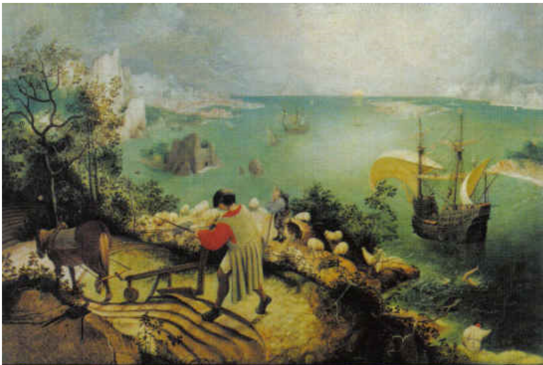
Pieter Bruegel (starszy), Pejzaż z upadkiem Ikara , ok. 1558, Królewskie Muzeum Sztuk Pięknych w Brukseli.

W jaki sposób twórcy późniejszych epok nawiązują do starożytnych mitów? Odpowiedz na podstawie interpretacji obrazu Pietera Bruegla Pejzaż z upadkiem Ikara i wybranego tekstu literackiego.